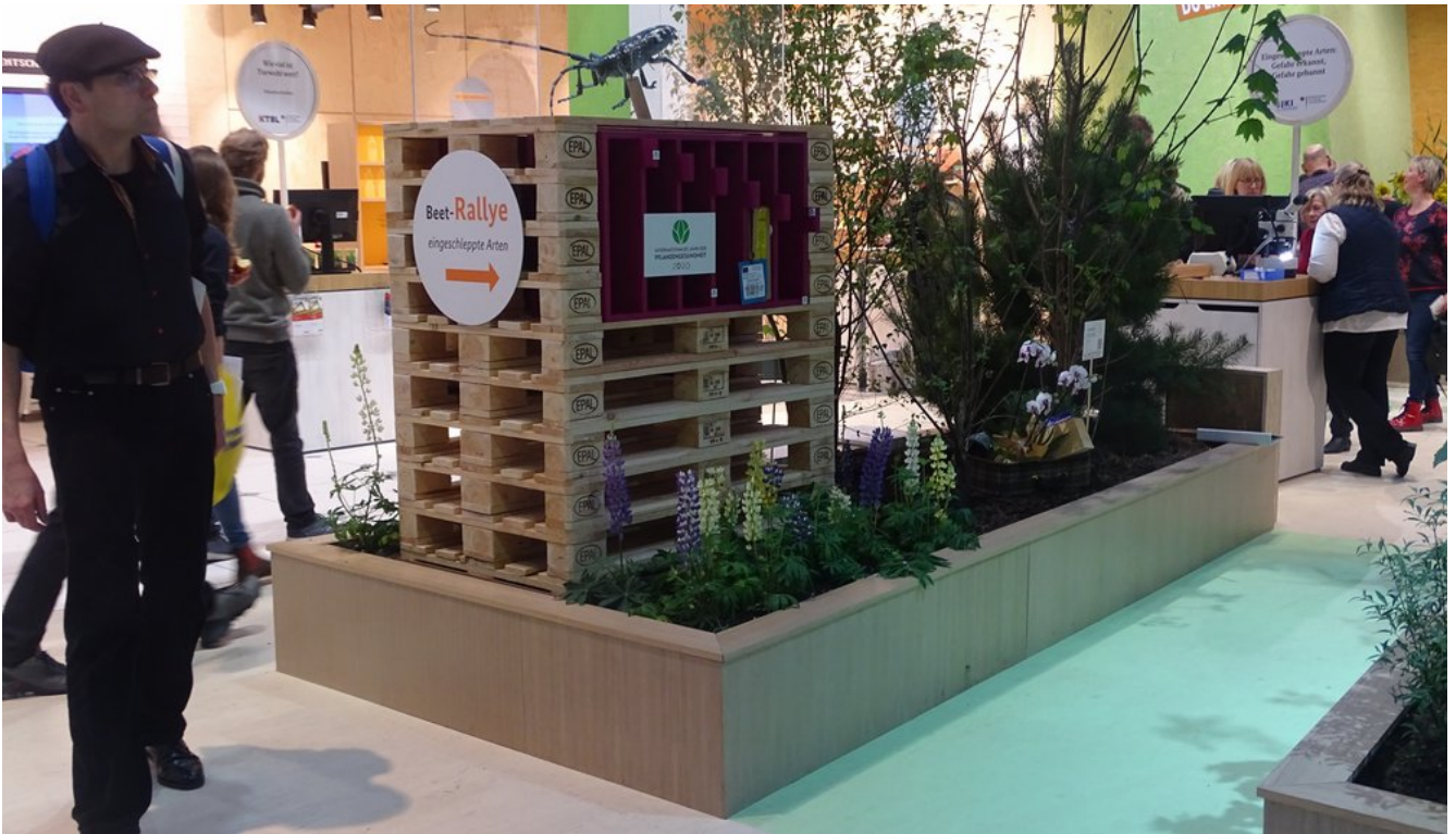
« Zurück IGW2020 (23) (Bild 16 von 26) Vorwärts »