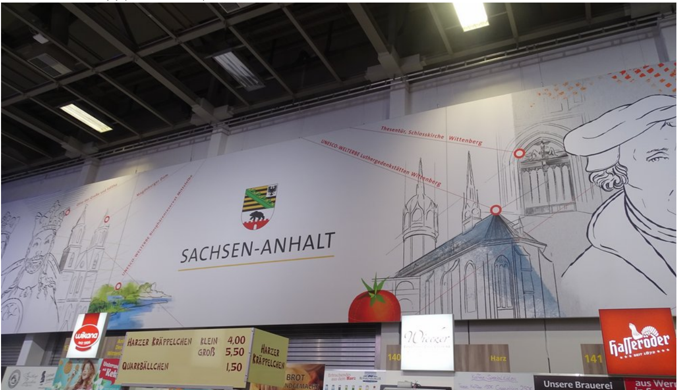
« Zurück IGW2020 (4) (Bild 21 von 26)Vorwärts »