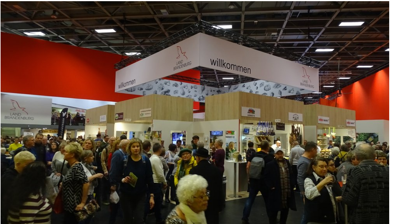
« Zurück IGW2020 (18) (Bild 10 von 26) Vorwärts »