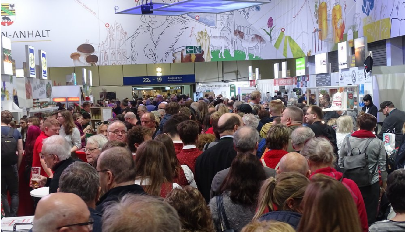
« Zurück IGW2020 (3) (Bild 20 von 26)Vorwärts »