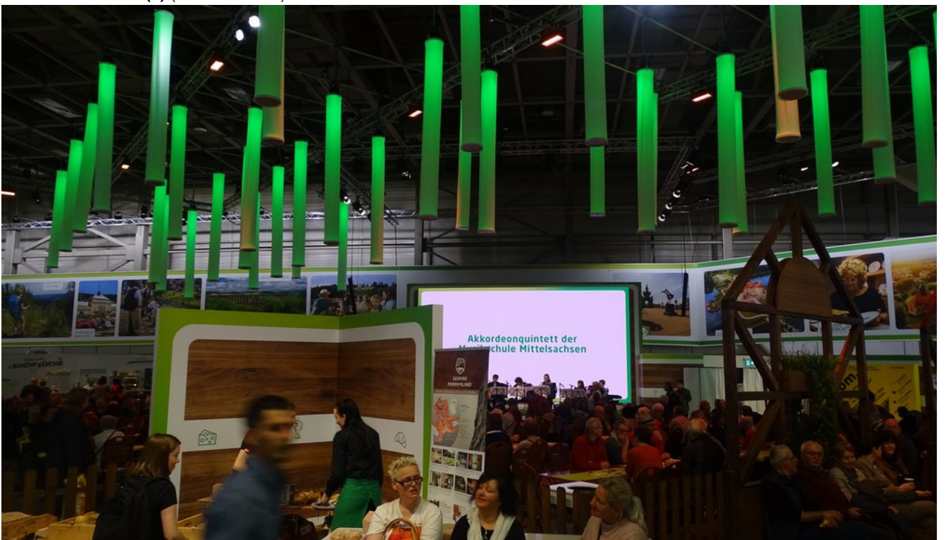
« Zurück IGW2020 (20) (Bild 13 von 26) Vorwärts »