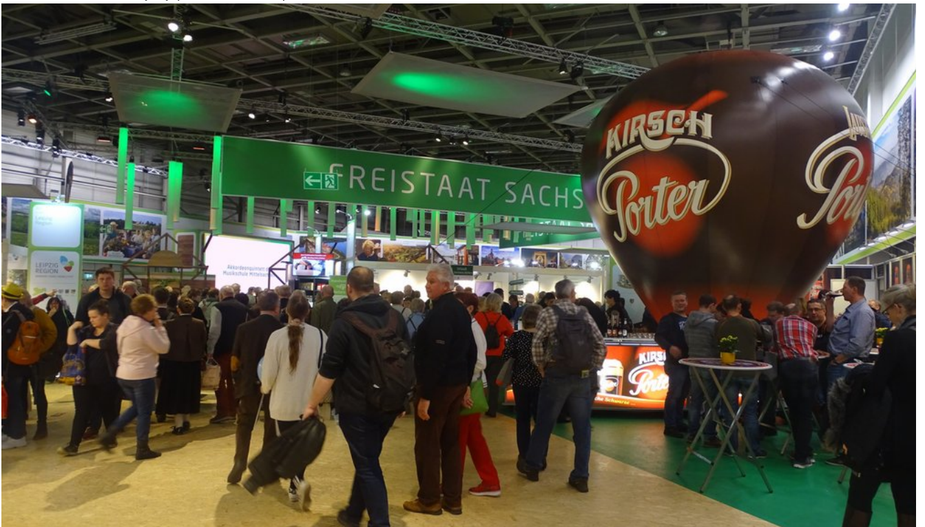
« Zurück IGW2020 (19) (Bild 11 von 26) Vorwärts »