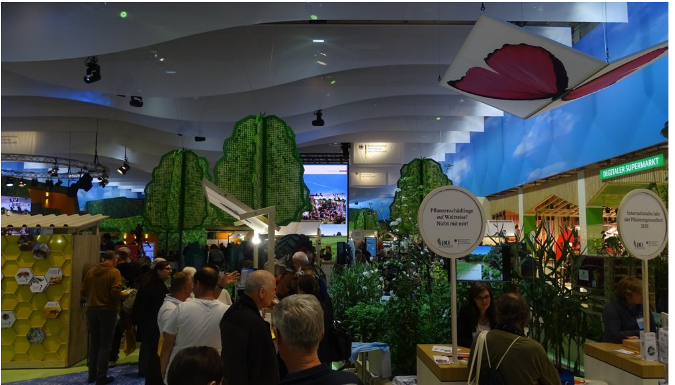
« Zurück IGW2020 (21) (Bild 14 von 26) Vorwärts »