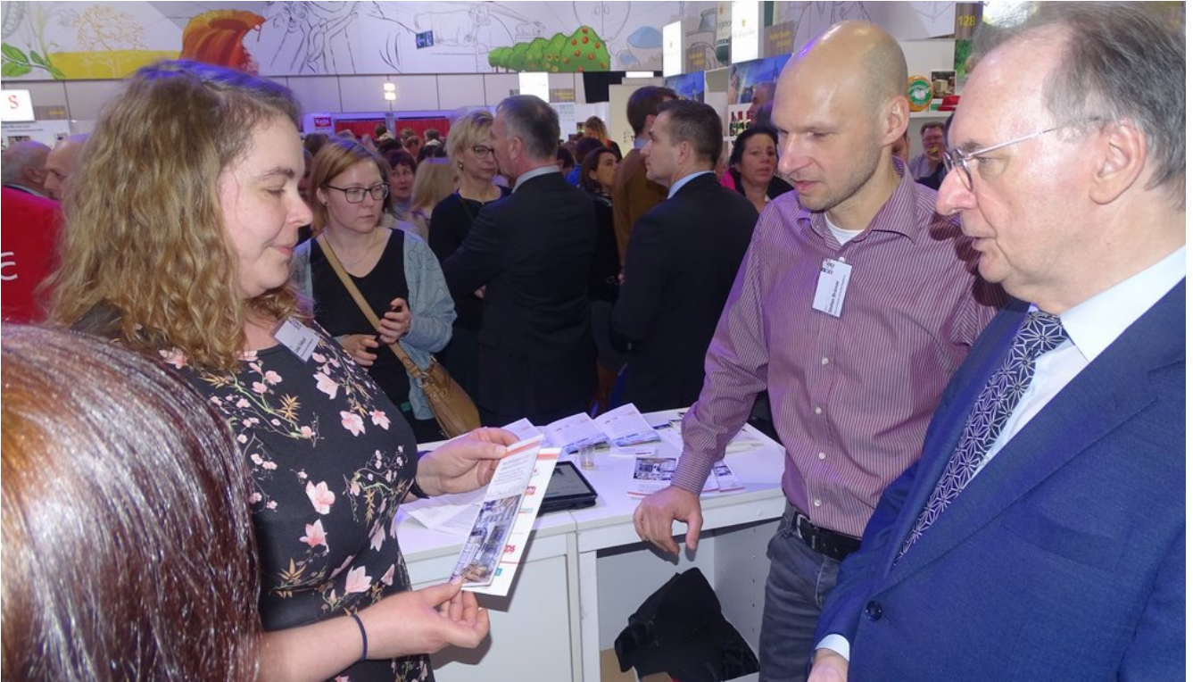
« Zurück IGW2020 (14) (Bild 6 von 26) Vorwärts »