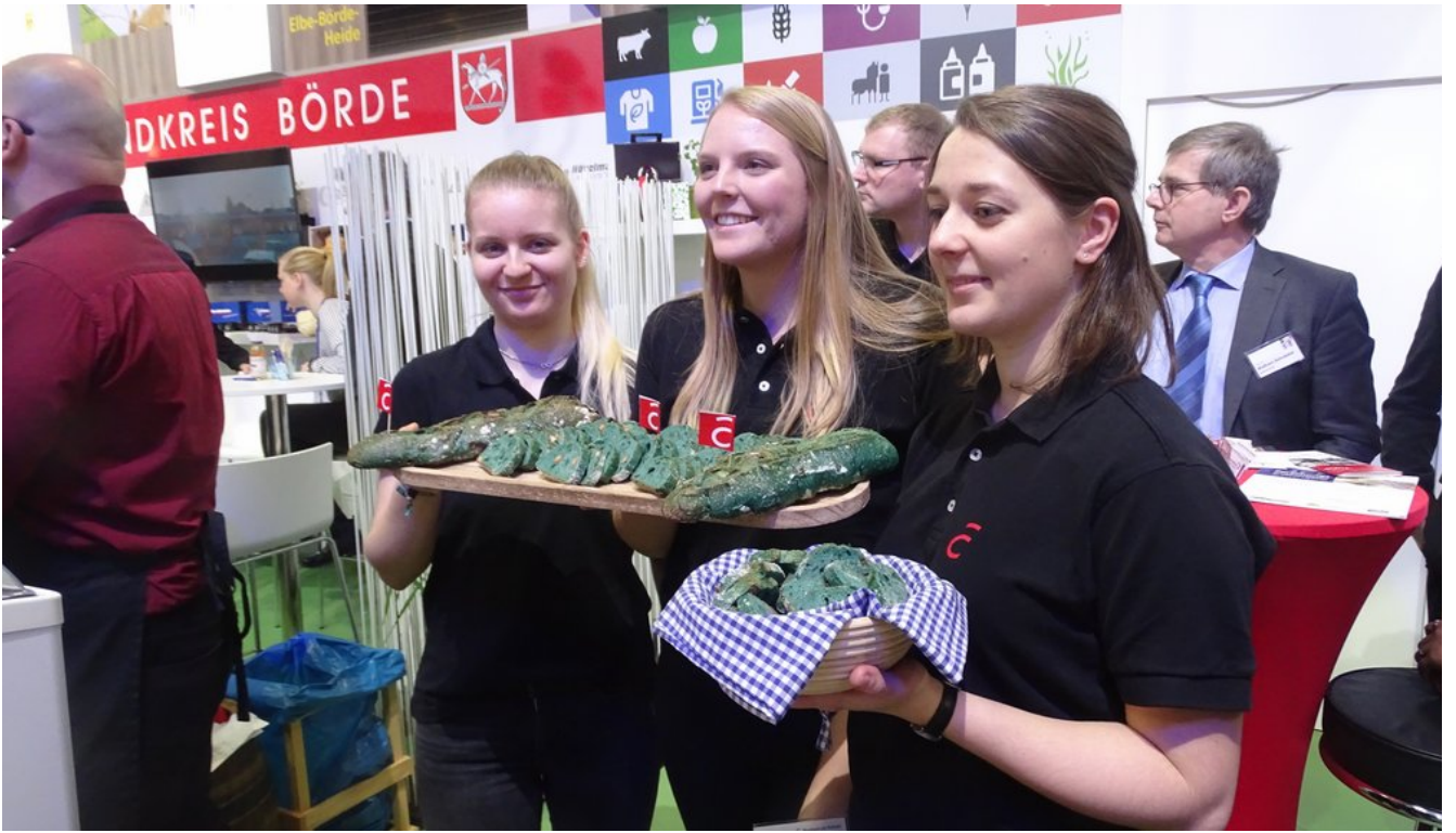
« Zurück IGW2020 (7) (Bild 24 von 26)Vorwärts »