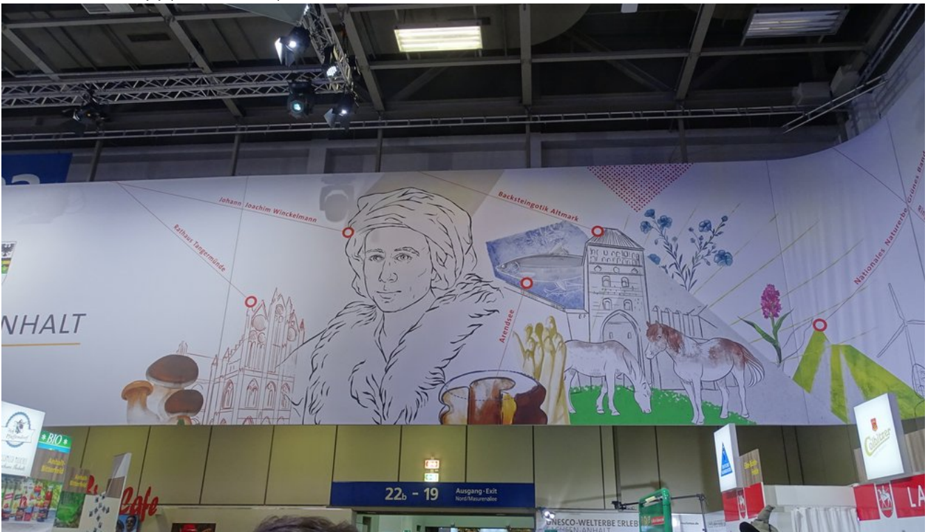
« Zurück IGW2020 (8) (Bild 25 von 26)Vorwärts »