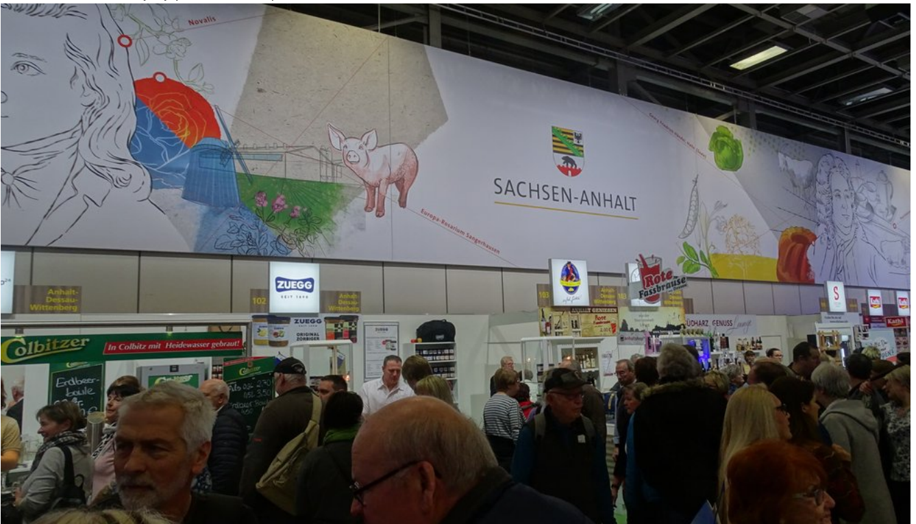
« Zurück IGW2020 (15) (Bild 7 von 26) Vorwärts »