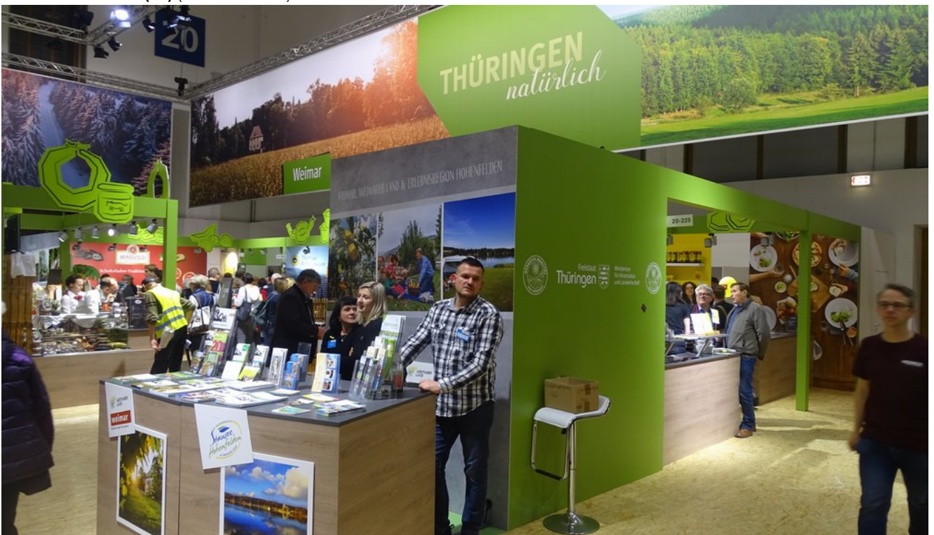
« Zurück IGW2020 (24) (Bild 17 von 26) Vorwärts »