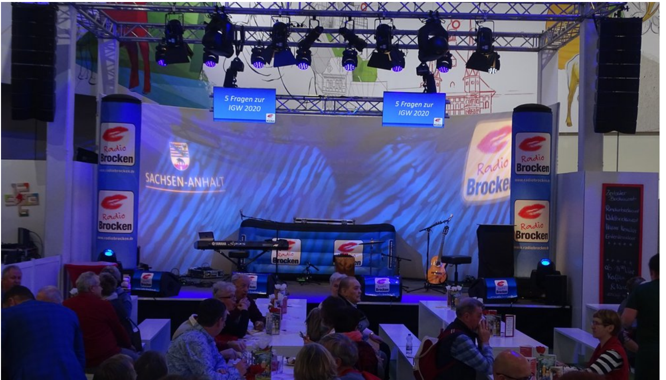
« Zurück IGW2020 (2) (Bild 12 von 26) Vorwärts »