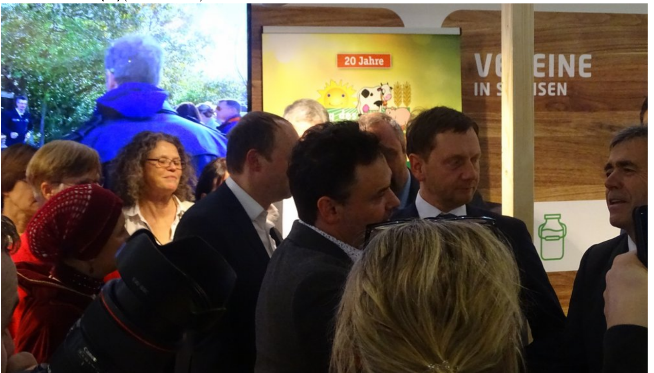
« Zurück IGW2020 (26) (Bild 19 von 26) Vorwärts »