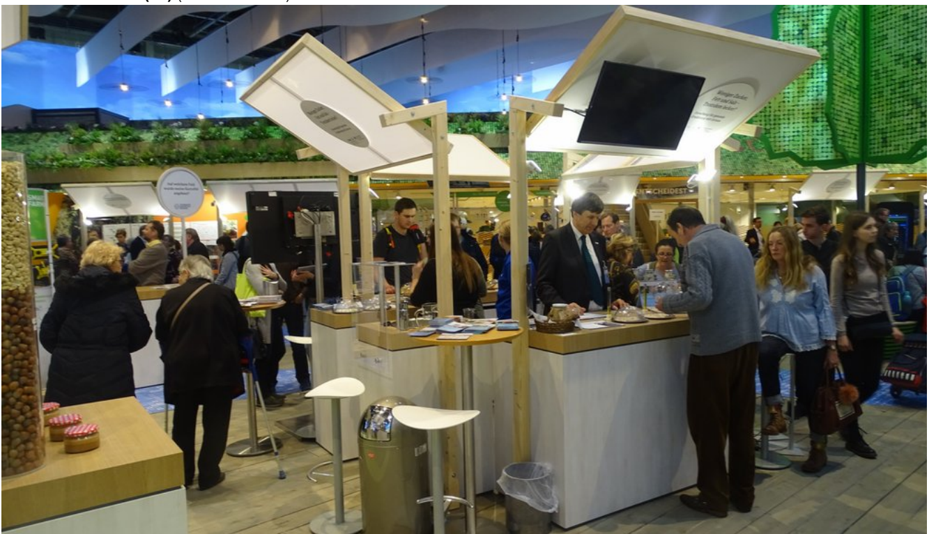
« Zurück IGW2020 (22) (Bild 15 von 26) Vorwärts »