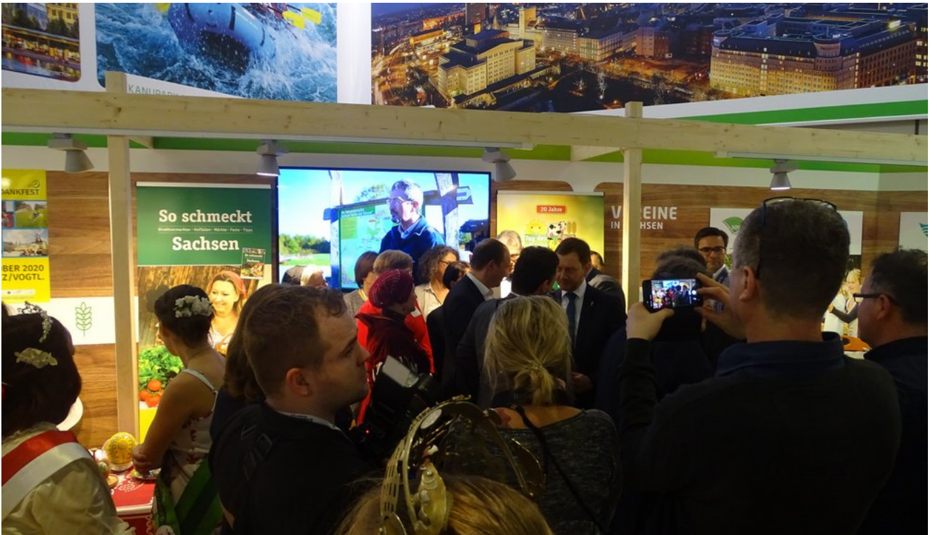
« Zurück IGW2020 (25) (Bild 18 von 26) Vorwärts »