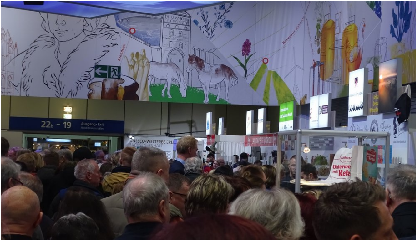
« Zurück IGW2020 (5) (Bild 22 von 26) Vorwärts »