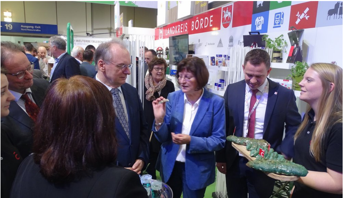
« Zurück IGW2020 (12) (Bild 4 von 26) Vorwärts »