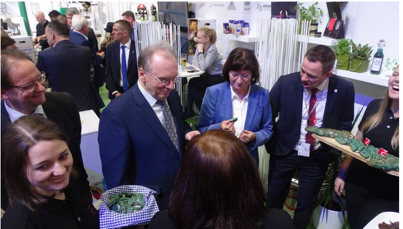
« Zurück IGW2020 (13) (Bild 5 von 26) Vorwärts »