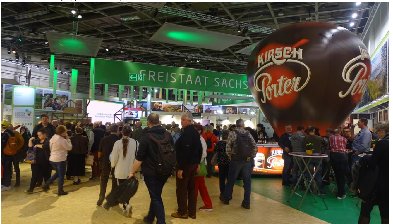
« Zurück IGW2020 (19) (Bild 11 von 26) Vorwärts »