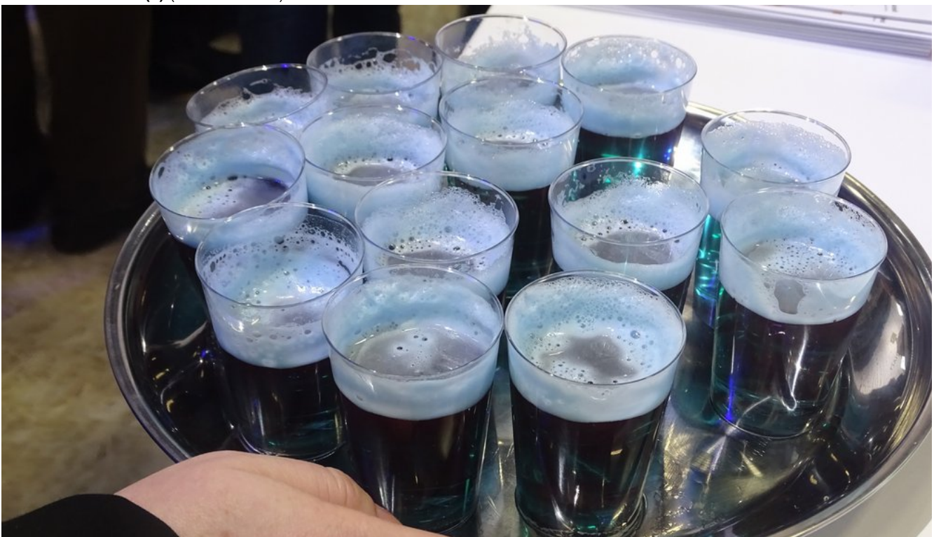
« Zurück IGW2020 (6) (Bild 23 von 26)Vorwärts »