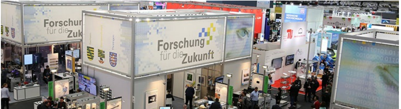
Impressionen von Messeauftritten