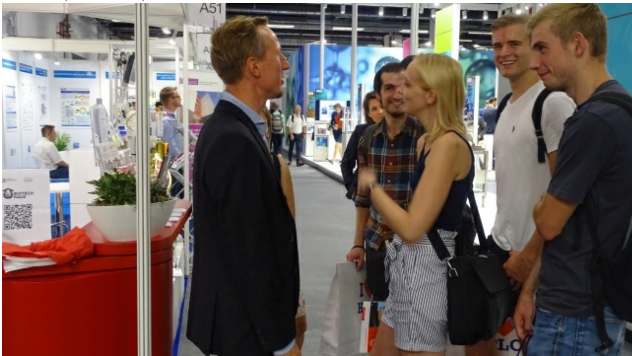
DSC09686 (Bild 12 von 13) Vorwärts »