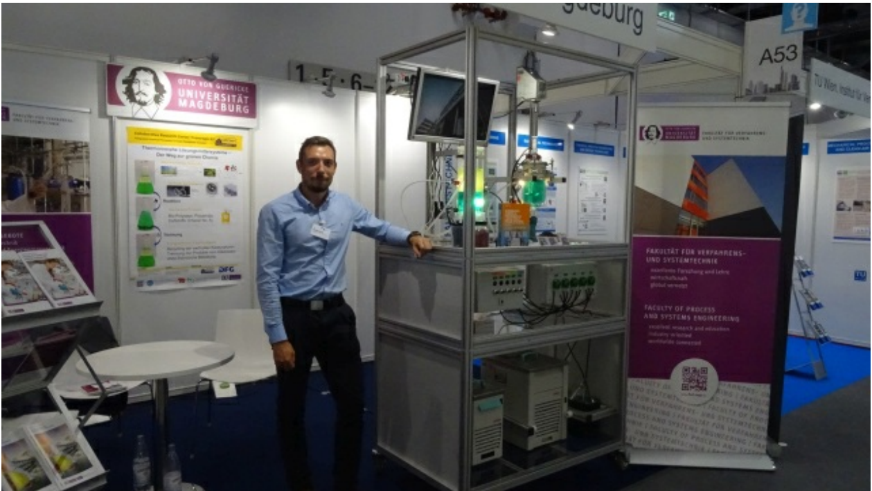
20220825_140930 (Bild 6 von 13) Vorwärts »